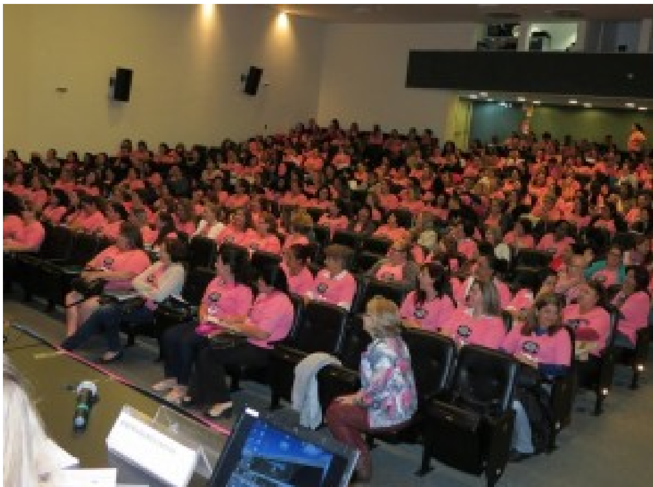
Imagem Caso Exemplar

Quase 800 agentes de saúde comunitários de sete cidades da Grande Florianópolis foram capacitados em 2016, nos temas câncer de mama e seu tratamento e outros assuntos que fazem parte do dia a dia desses profissionais na orientação à população, como saúde do homem, câncer de pele, violência doméstica, entre outros, promovida pela AMUCC. O curso contou com a participação de médicos especializados em câncer de mama e colo de útero, defensores públicos e representantes das Secretarias de Saúde das cidades convidadas (Florianópolis, São José, Biguaçu, Palhoça, Rancho Queimado, Santo Amaro e Tijucas). O objetivo foi empoderar os agentes comunitários para que a prevenção do câncer seja feita de forma mais rápida, aumentando as chances de cura.